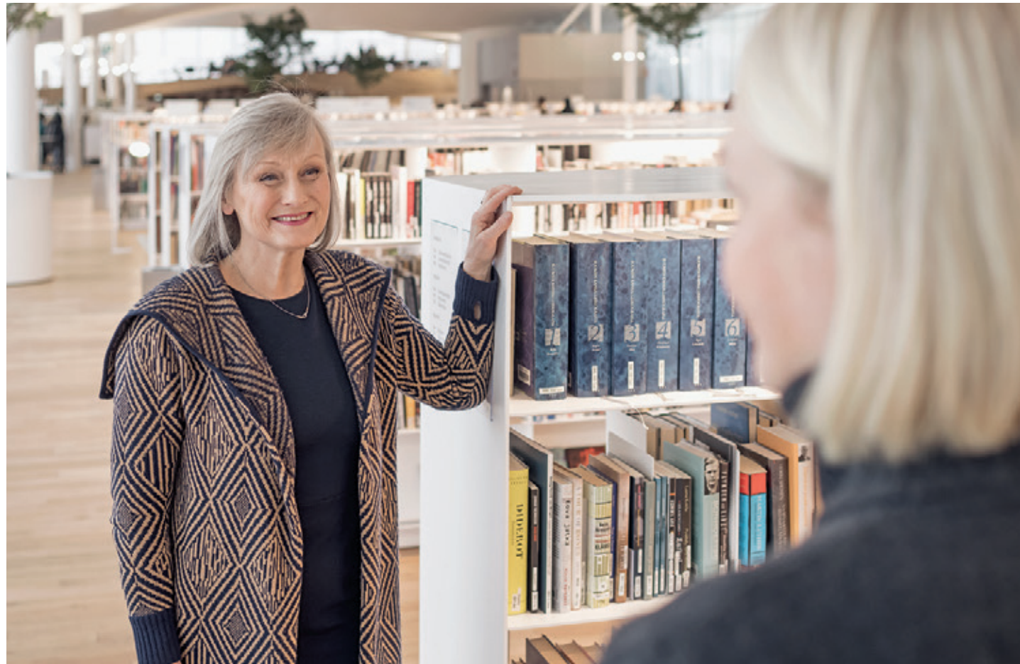
Arja kohtaa nuoren naisen Oodin kahvilassa ja tapaaminen päättyy halaukseen.