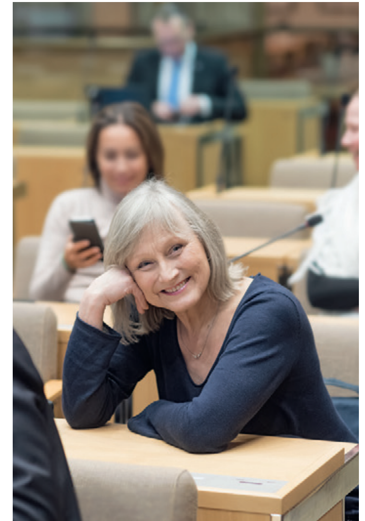
Arja on ollut Helsingin kaupunginvaltuutettu vuodesta 2004 ja on lisäksi toiminut kaupunginsuunnittelulautakunnassa, Uudenmaanliiton maakuntavaltuustossa sekä Helsingin kaupunginteatterin edustajistossa, puheenjohtajana.

KUN YLILÄÄKÄRIT EIVÄT OTTANEET PUHELUITANI VASTAAN, PÄÄTIN LÄHTEÄ MUKAAN POLITIIKKAAN.