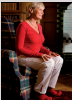
NOUSE TURVALLISESTI JA VAHVISTA REISIÄ